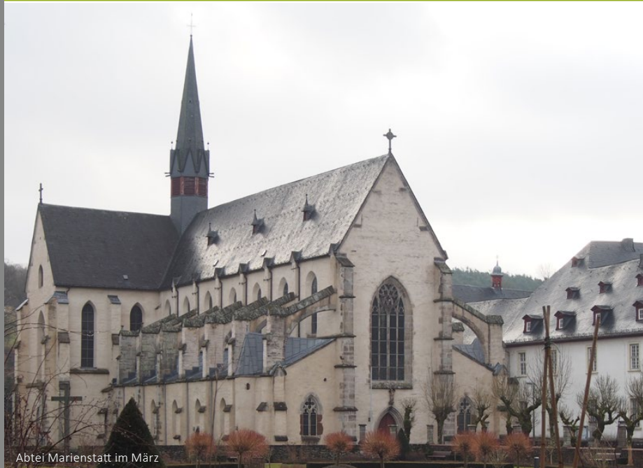
Abtei Marienstatt im März

Wie schade also, wenn wir erst im eigenen Tod wirklich erfahren, welche grundlegende Bedeutung das Sterben für unser Leben hat!