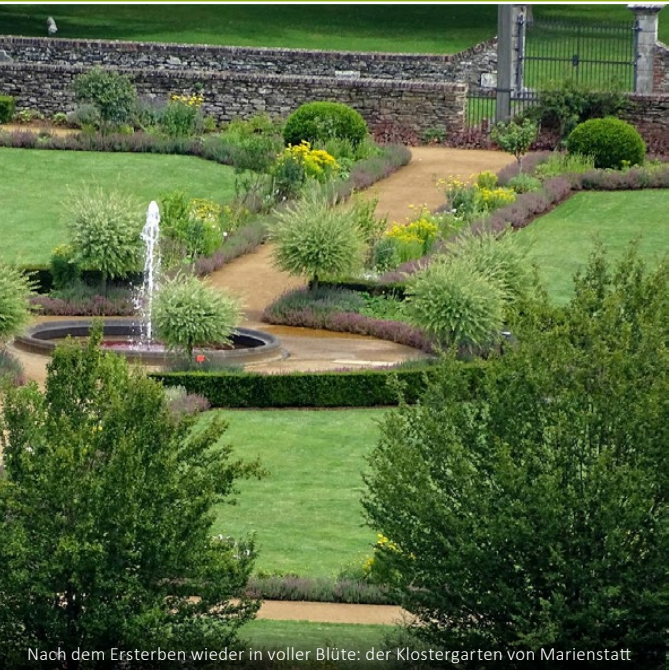
Nach dem Ersterben wieder in voller Blüte: der Klostergarten von Marienstatt